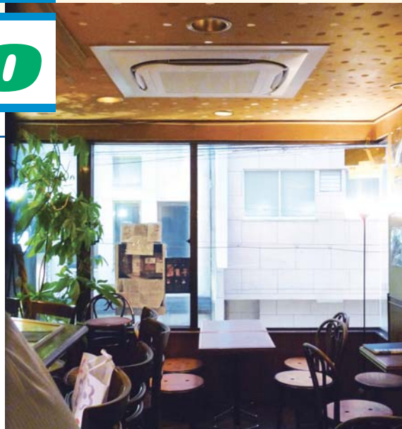
センシングフローが席による温度差を解消

もう一つ、契約電力を3kWから2kWに小さくできることも魅力でした。買い替えを相談したホシザキさんに細かな試算書を見せてもらうと、契約電力料金が毎月約1,000円削減できる。契約電力は1日中開いているお店ならともかく、19~24時しか営業しないバーには時に重荷ですからね。リースが使ってまともまった入替費用を用意しなくてもよかったこと、さらにその料金が予想より低かったこと、省エネ機能で電気代も大幅に安くなることも大きかったですね。