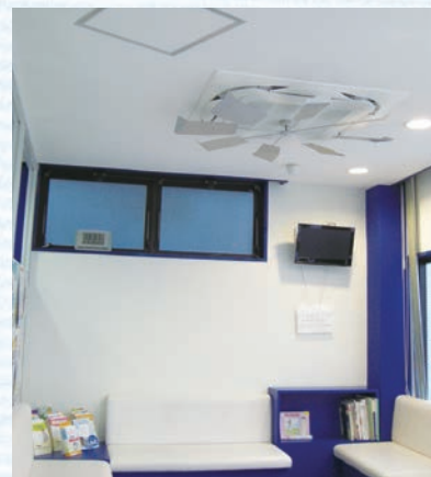
患者さんやスタッフが過ごす受付・待合スペースに『ストリーマZEAS』を採用

入替えた効果はてきめんで、ニオイもしなくなりました。それほど設定温度を下げなくても涼しく湿度も抑えられ、患者さん達やスタッフ達にようやく快適な空気環境を提供できたなと思っています。ニオイがおさえられ、エアコンの内部をキレイに保ってくれる『ストリーマZEAS』には、未長く期待したいですね。