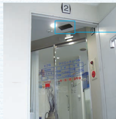
開院時間前から待ち並ぶ患者さん達のために、ドアの外側にもエアコンの吹出し口を新設