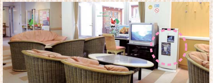
2階、新生児とご家族の面会室にパワフル光クリエールを設置。